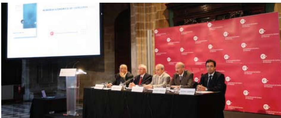
Una altra imatge de l'acte de presentació de la memòria

“La superació de la crisi actual i el disseny d'un nou model econòmic de futur per al Principat exigeixen establir prioritats i estratègies que permetin reforçar els punts forts del nostre teixit productiu”